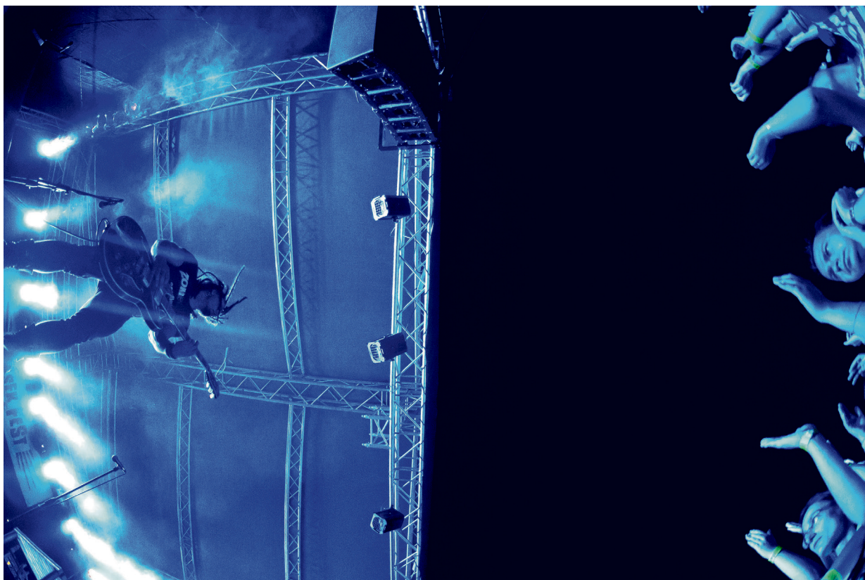
Snímek Obě strany od Jiřího Hlouška zvítězil v kategorii dokumentární fotografie. Fotoreportér na ní zachytil kytaristu skupiny Mandrage, která se představila na letošním Pelíšek festu v Bystřici nad Pernštejnem.

„Porota ocenila také snímky ve zvláštních kategoriích, jako byl fotografický příběh, architektura Bystřicka nebo rok Pernštejnů. Nejlepší fotografii mohli vybírat také návštěvníci našeho webu,“ doplnila Krásenská.